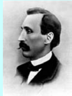
П. О. Куліш