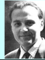
В. О. Сухомлинський